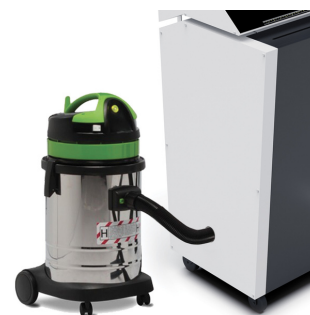
OPTIONAL: aspiratore DCS-500 per ottenere materiale privo di polveri